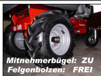
Koło do wolnego obrotu