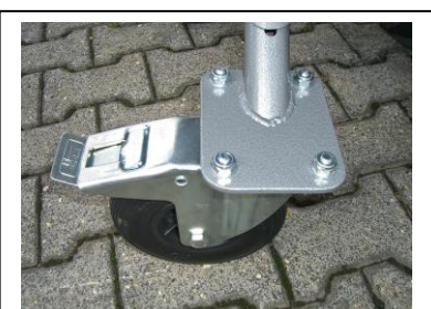
Rolki z hamulcem