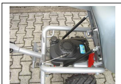
Łatwy dostęp serwisowy