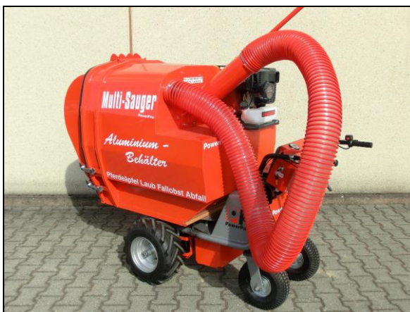
Multi-Cleaner typ MCS520 Zamontowany na MCE400 z dłuższą