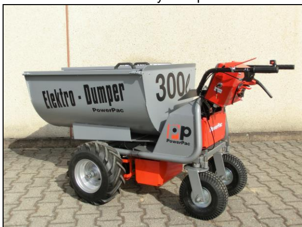
Wózek na pasze 300litr. Zamontowany na MCE400 z dłuższą