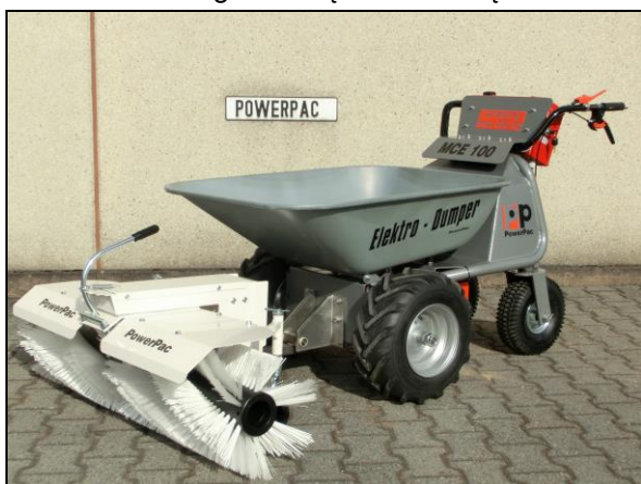
szczotka 105cm – napędzana mechanicznie z adapterem