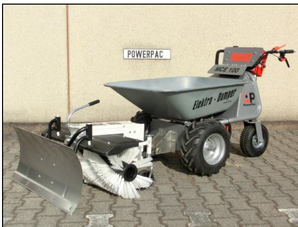
szczotka 85cm – napędzana mechanicznie