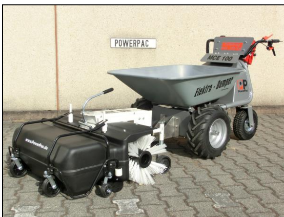
szczotka 85cm – napędzana mechanicznie