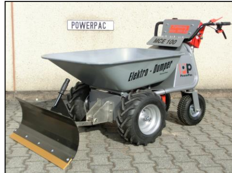
Szufla śnieżna 85cm Z gumą i adapterem