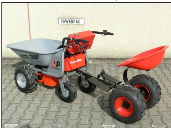
Siedzenie ze sprężyną, Hamulec nożny i adapter