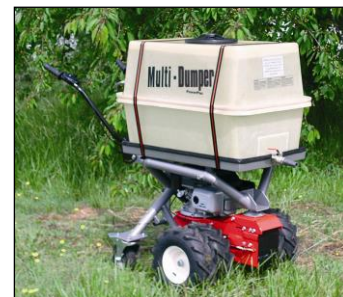
Zbiornik 200 ltr.,