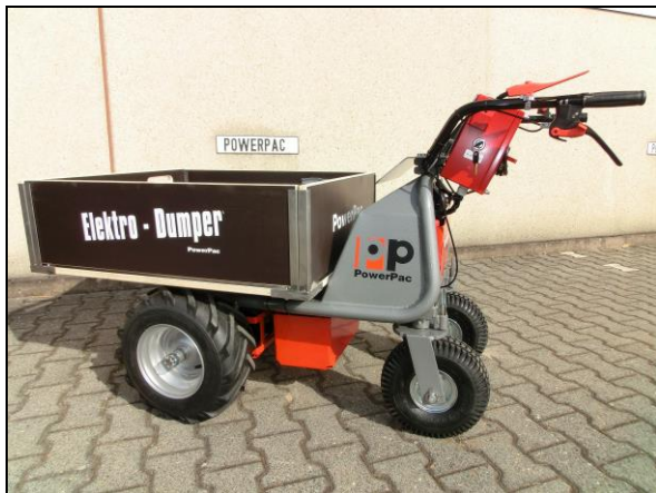
Platforma transportowa z regulowaną szerokością