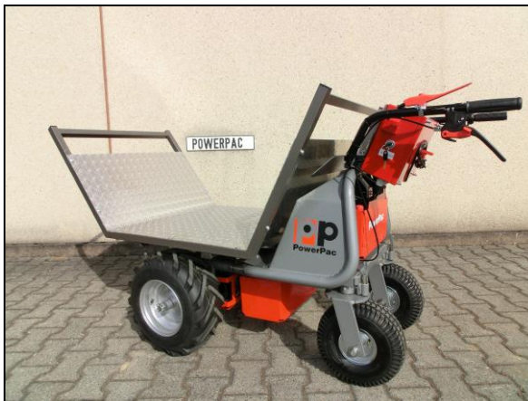
Platforma do transportu drewna