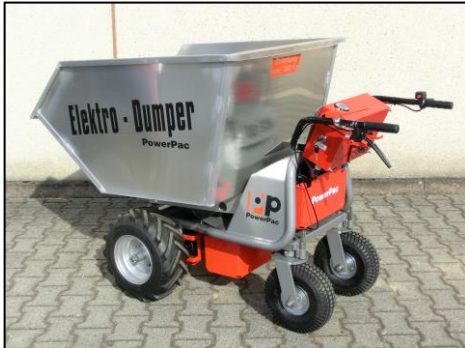
Wanna na lekki ładunek 450ltr. wymiary: 1160x850x565mm